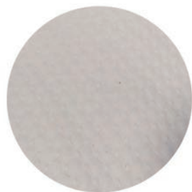
> MANTEL BLANCO