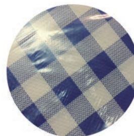
> MANTEL AZUL

Mantel cuadro azul 1 x 1 caja de 300 unidades